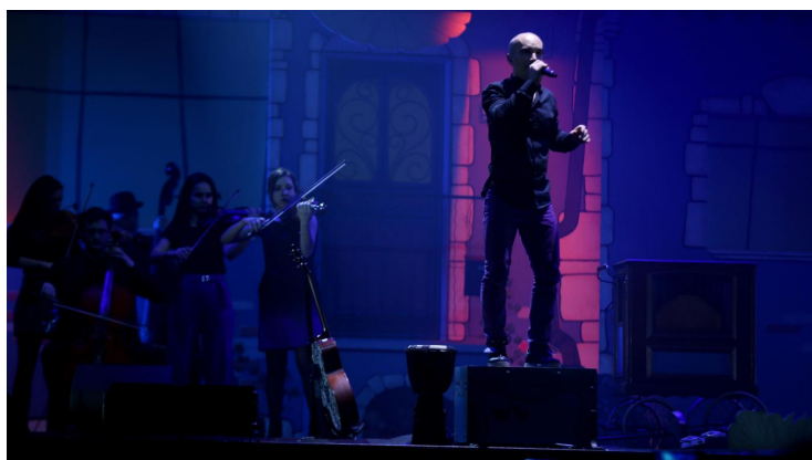
Aldebert, l'idole des plus jeunes, hier soir au Zénith de Lille.